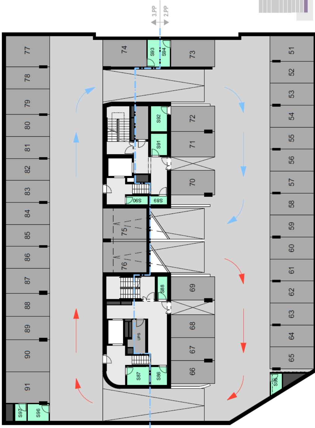
Schema půdorysu bytu představuje dispozici řešení bytu. Kuchyňská linka a nábytek není součástí dodávky bytu, zařízení je zobrazeno pouze pro názornost.