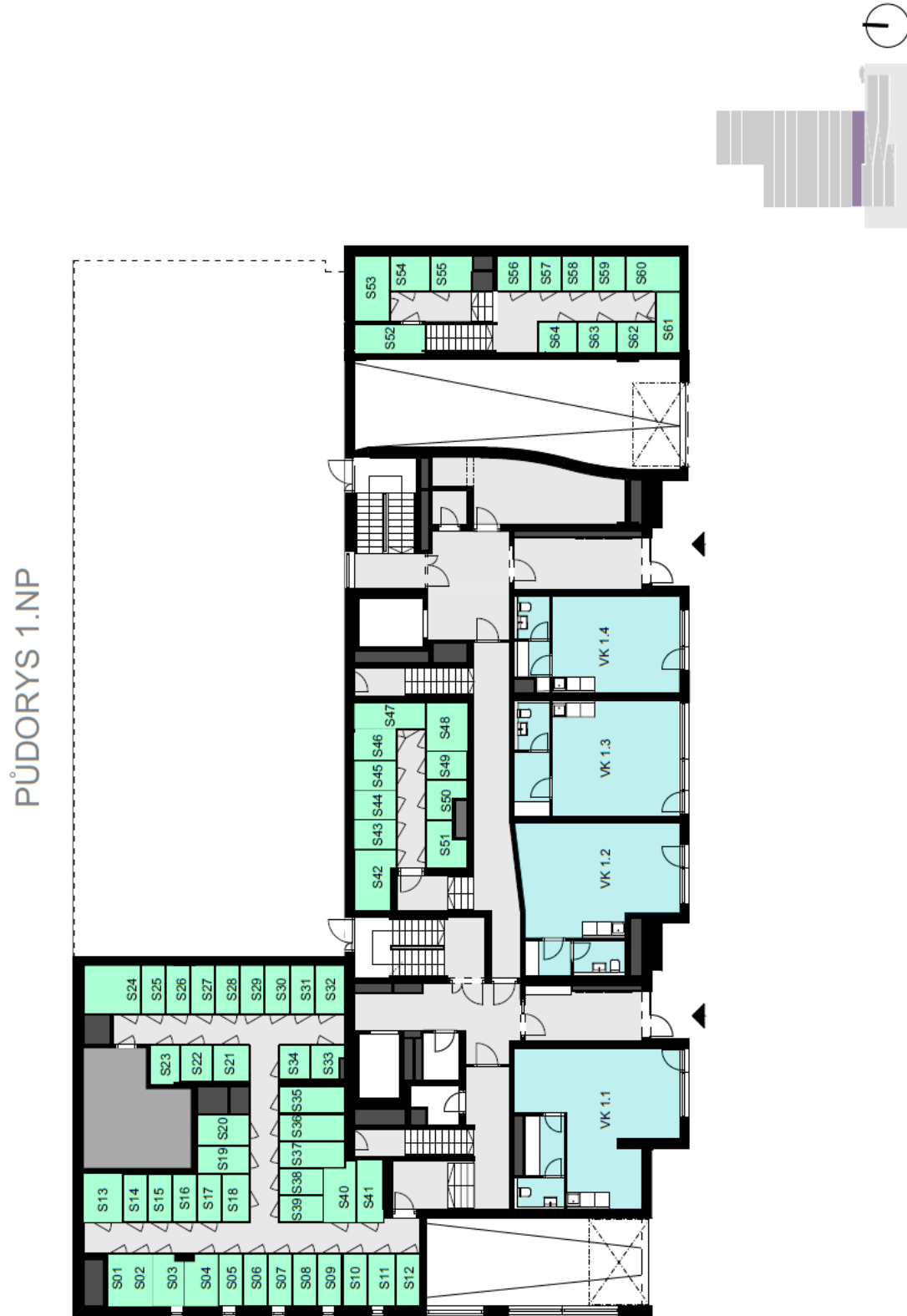
Schema půdorysu bytu představuje dispozici řešení bytu. Kuchyňská linka a nábytek není součástí dodávky bytu, zařízení je zobrazeno pouze pro názornost.